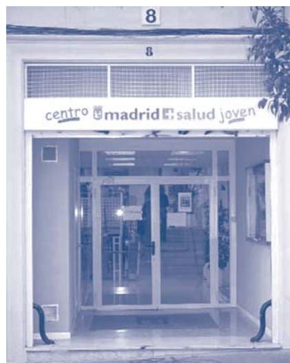
FIGURA 2. Centro Madrid Salud Joven

Consideramos que un centro específico, con horarios flexibles (mañana, tarde y fin de semana), con profesionales dedicados exclusivamente a trabajar con la juventud y adolescencia, donde se puedan desarrollar proyectos y programas, que los chicos y chicas identifiquen como propio: es una mejora evidente en la calidad de atención que prestamos desde el Ayuntamiento de Madrid.